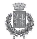
Comune di Castelfranco Piandiscò